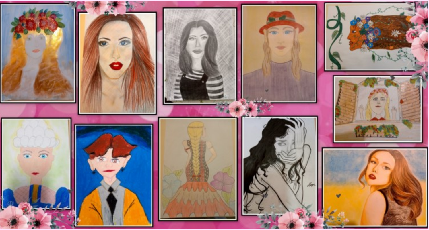
Piękno Kobiet w pracach plastycznych naszych uczniów